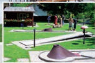
Minigolfanlage direkt neben der Terrasse