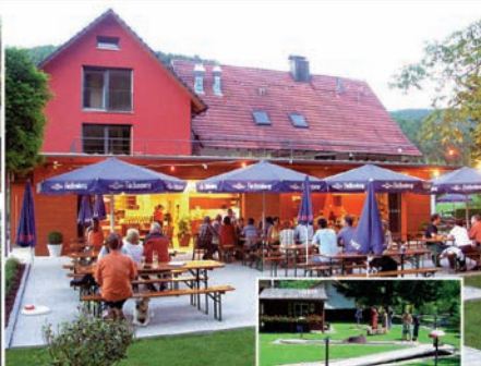
Minigolfanlage direkt neben der Terrasse